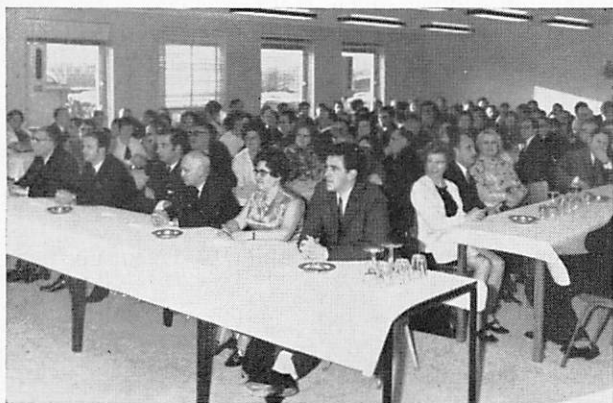
Algemeen gezicht in de zaal.