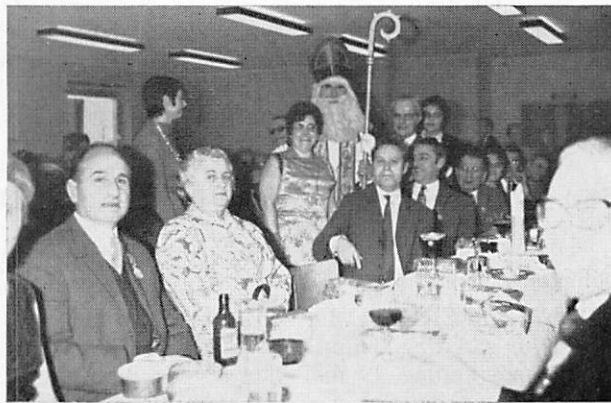
Sint Niklaas was ook van de partij!