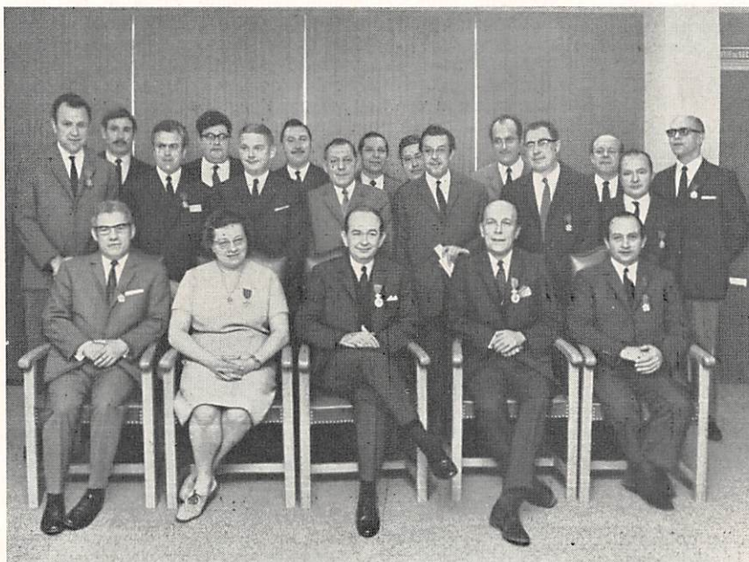
De gedecoreerden op het Hoofdbestuur waren dit jaar zeer talrijk. Om ze te fotograferen dienden ze in twee groepen te worden gescheiden.

« Wij zullen eveneens diegenen huldigen aan wie het de Koning behaagd heeft onderscheidingen in de Nationale Orden toe te kennen voor de diensten, die zij aan het land bewezen hebben door hun activiteit bij de Nationale Maatschappij.