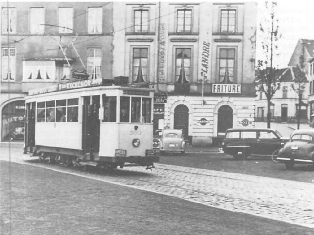
Motorrijtuig 389 op lijn 5 aan het St.-Pietersplein op 20.05.56.

In de jaren vijftig worden ze gemoderniseerd zoals de rijtuigen van de reeks 316-387 op het lanterneau, de controllers en de motoren na. De 393 komt het eerst buiten op 04.12.52. Ook na deze modernisatie zal het de reeks zijn die het minst in dienst komt op het net en het is dan ook niet verwonderlijk dat na de buitendienststelling van de 301 het een rijtuig van deze reeks zal zijn die als tweede drieassers afgebroken wordt in 1963 (388, 390). Zeer vlug volgt dan de rest van de reeks: 1964 (392, 389) 1965 (393) en 1967 (391). Van deze reeks rijtuigen bleef geen enkel bewaard.