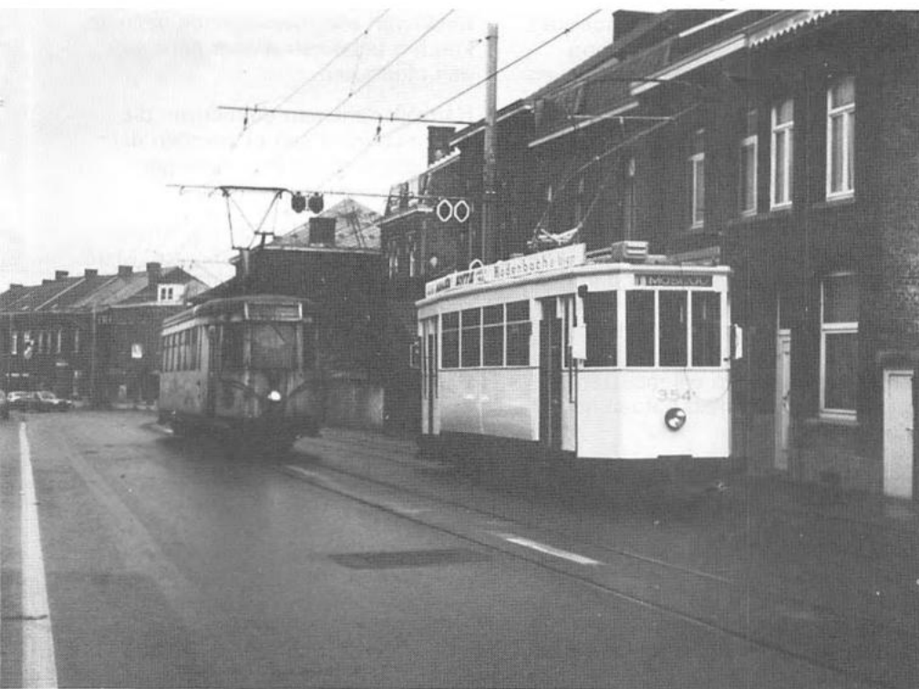
De 354 tijdens één van de talrijke proefritten op het Henegouwse Buurtspoorwegnet.