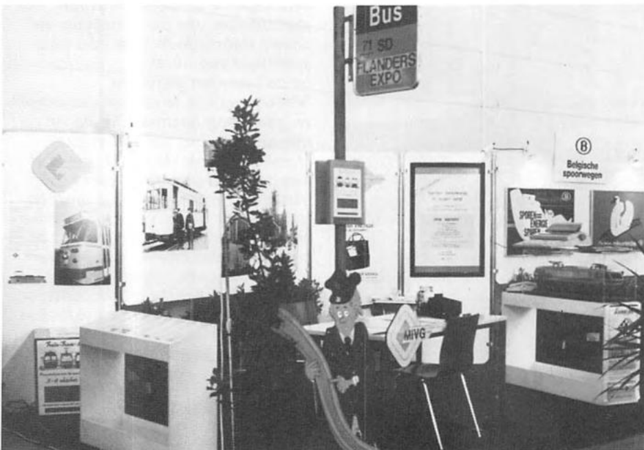
De stand van de M.I.V.G.