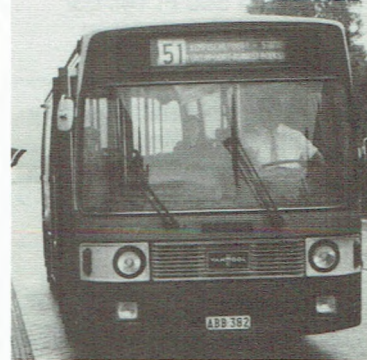
Sedert 13 augustus stoppen de oranje bussen opnieuw op de Maastrichtersteenweg.

Toen enkele jaren geleden beslist werd om de Maastrichtersteenweg te moderniseren, verdwenen de Buurtspoorwegen van deze weg. De terugkeer van de oranje bus is het gevolg van lange onderhandelingen