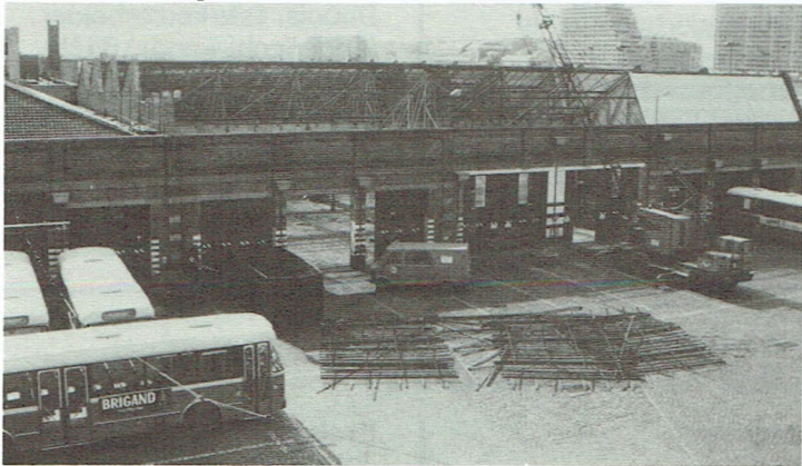
Een kijkje tijdens de werken aan het nieuwe dak. Let op de structuur.

Weldra zal men er eveneens het onderhoud van de loopdraaistellen van de trams en het grote onderhoud van alle bussen uit de groep kunnen verrichten.