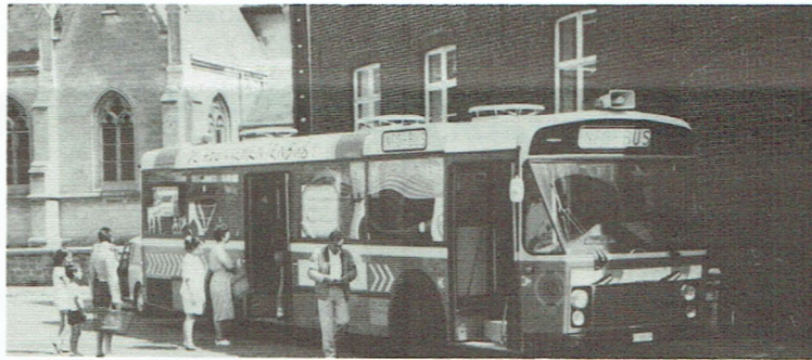
Eén van onze « abonnementenbussen »

Jaarlijks levert de Groep Limburg vóór 1 september zo'n 15.000 schoolabbonementen af.