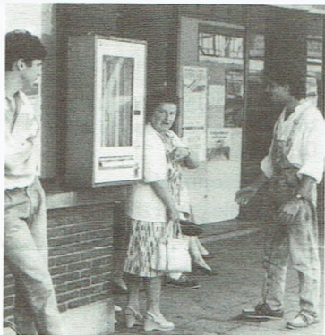
De reactie van deze dame, die blijktbaar in het nauw gedreven werd door booswichten, werd opgenomen met een verborgene camera.

De reactie van nietsvermoedende kusttramtoeristen werd netjes geregistreerd vanuit een gecamoufleerd busje. Hierin zat ook Martine Gysenbergs van onze commerciële dienst en