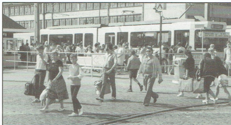
▲ Onze kusttram overspoeld? ▼ Het embleem dat onze kusttramaktie overkoepelt.

Een tweede groep reizigers bestaat uit de «pure» vakantiegangers. Zij nemen de kusttram als deel uitmakend van hun vakantiebeleving. Dankzij de tram worden zij een nieuwe vakantie-ervaring rijker, ondergaan ze een nieuwe gewaarwording, voelen ze zich vrijer, blijer en vitaler. Dit worden de exploratieve reizigers genoemd. Voor hen is de tram een doel op zichzelf en niet zozeer een middel om zich te verplaatsen.