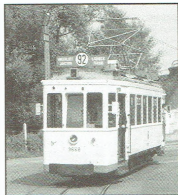
Zin in een nostalgisch ritje met de 9888?

Onlangs werd, onder het waakzame oog van controleur Francis Desorbaix, de oude motorwagen 9888 overgebracht van Trazegnies naar Anderlues.