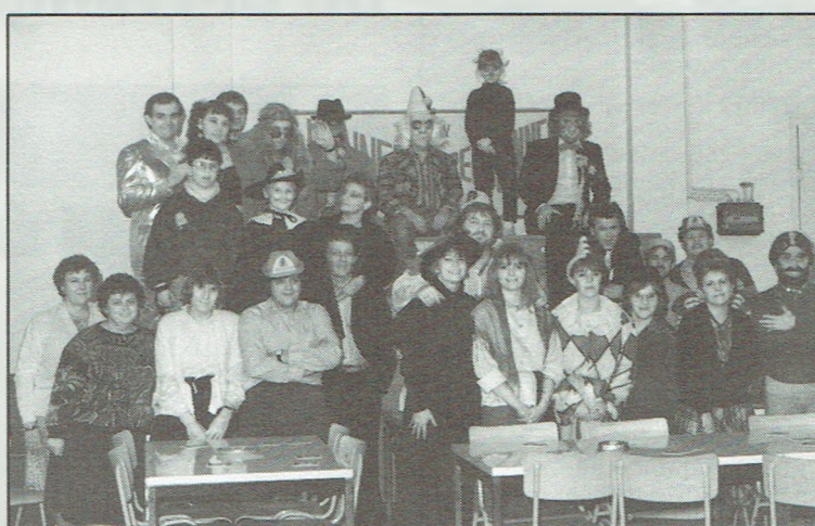
Na een jarenlange winterslaap organiseerde de vriendenkring van de stelplaatsen Doornik-Ath-Frasnes en Flobecq een karnavalbal. Dit initiatief werd een geweldig succes mede dank zij de prachtige kostumen, verkleedingen en opsmukken. (Foto: J.M. Nyssen).