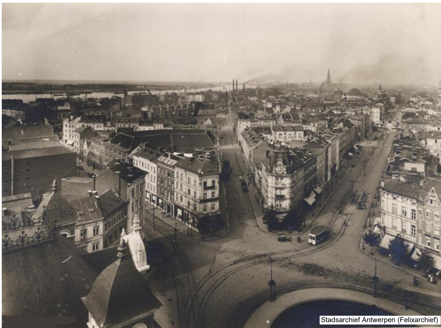
Foto genomen vanuit de toren, kant Bolivarplaats, in 1932. Links de torentjes van het hoekgebouw waarin zich de hoofdingang van de Zuidstatie bevond.

Van links af: de Jan Van Gentstraat, Gijzelaarsstraat en Emiel Banningstraat.