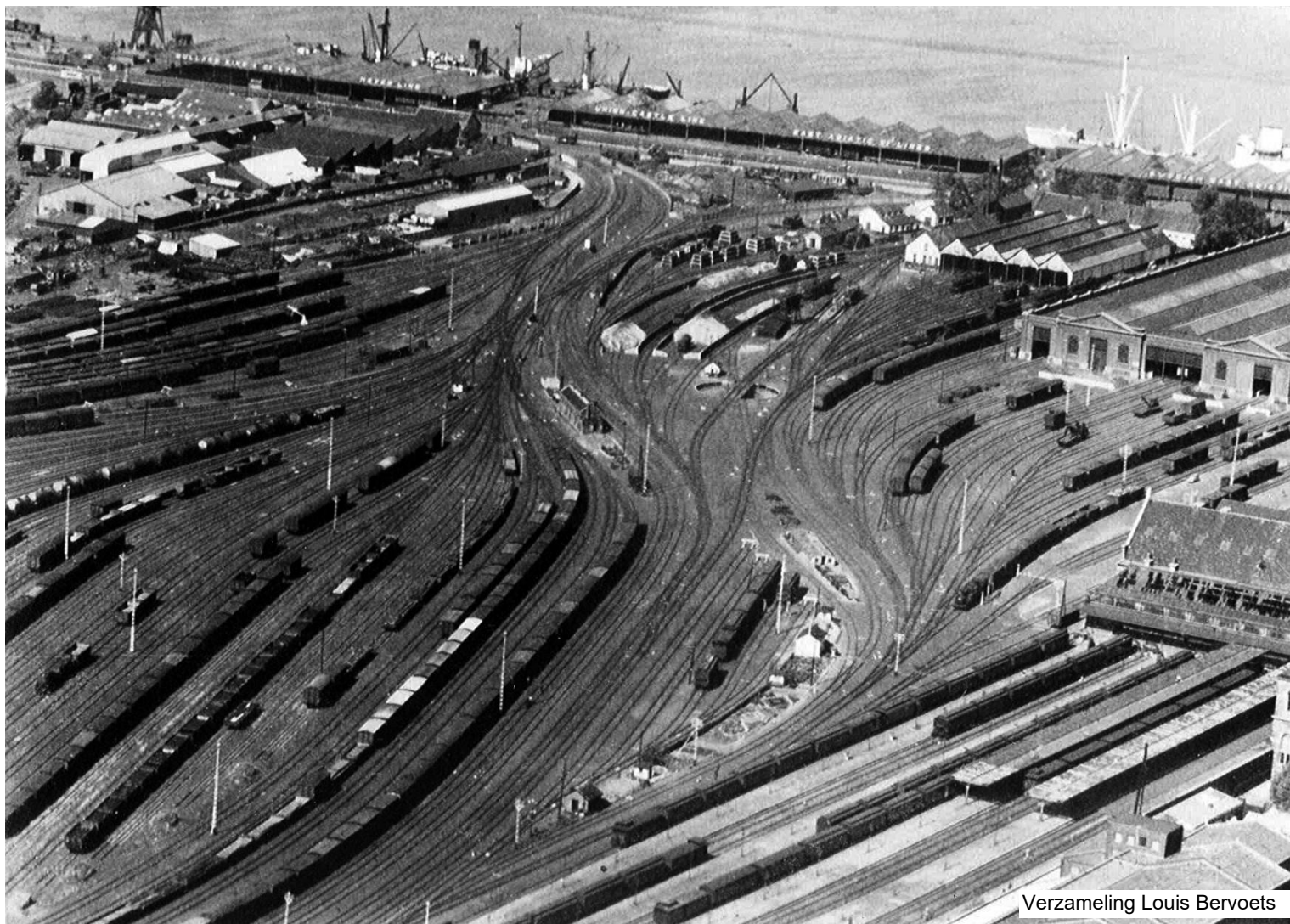
Foto genomen vanuit de toren richting Schelde, vermoedelijk begin jaren vijftig. Het locomotiefdepot naast de stukgoedloods was toen nog in dienst en de in de oorlog zwaar beschadigde overkapping van het kopperon was nog niet afgebroken.