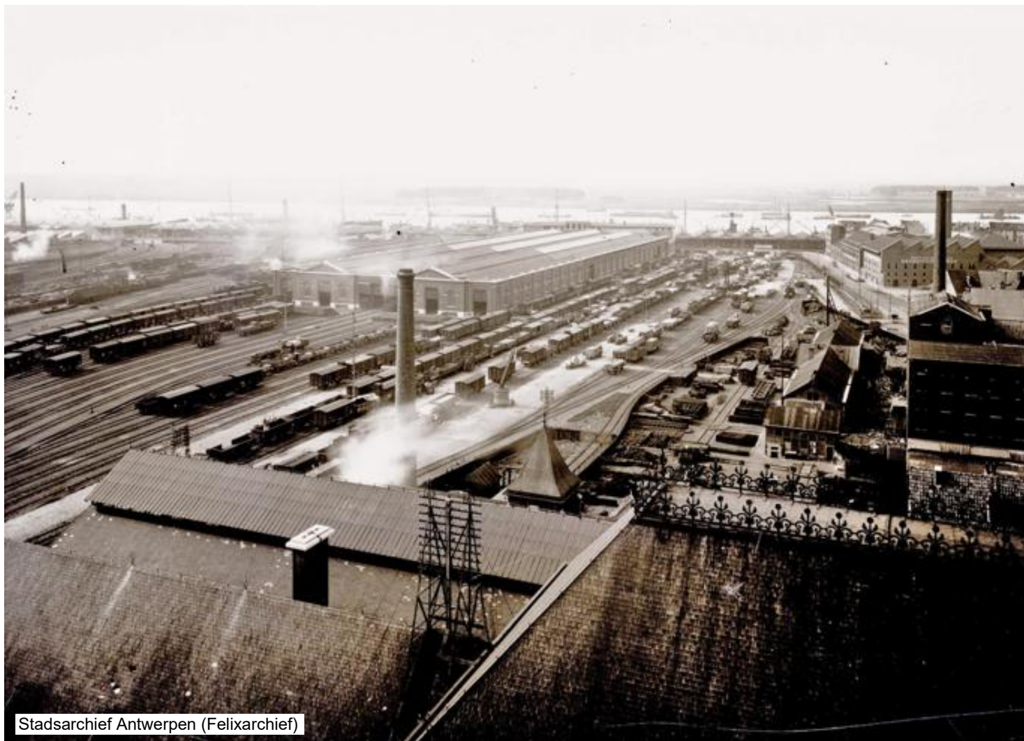
Foto genomen richting Schelde (Ledeganckkaai en d'Herbouvillekaai) in de jaren dertig.

Vooraan het goederenstation met de grote laad- en losplaats. Links de stukgoedloods.