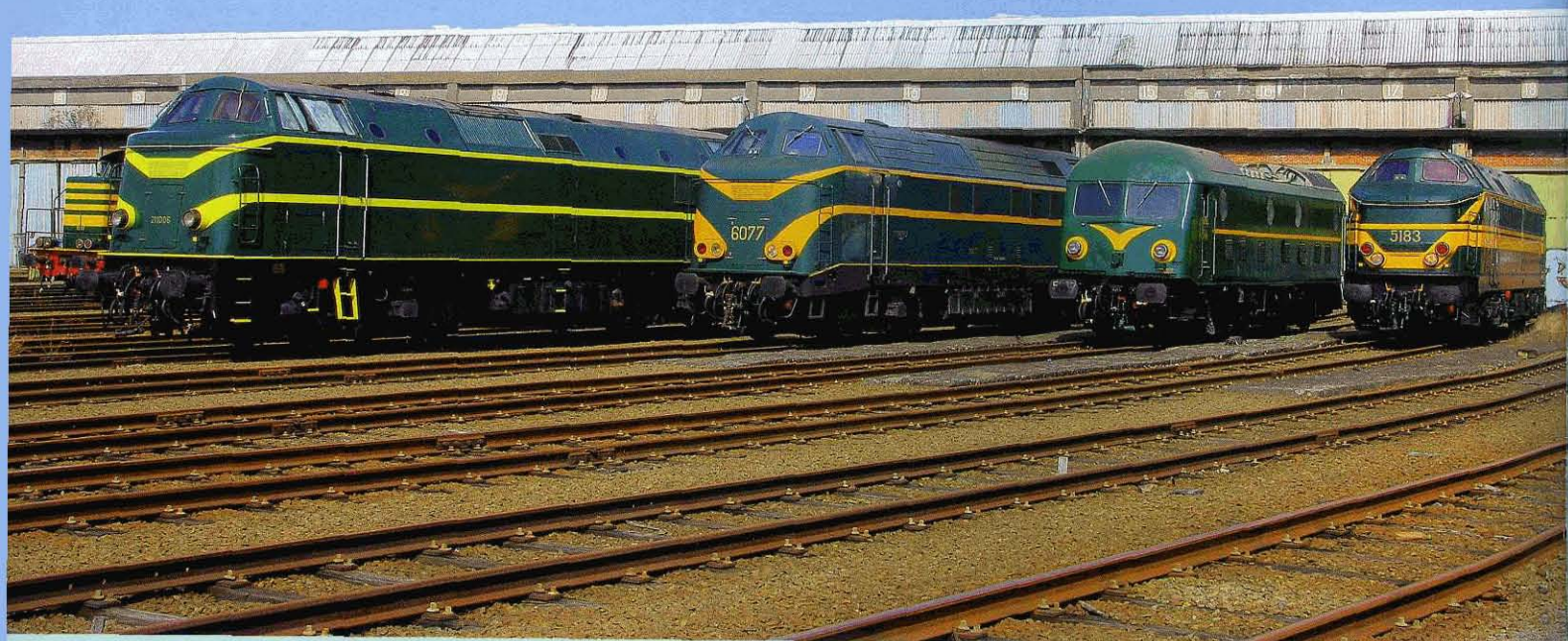
FOTO 117-01 Een mooie parallel voor de WDT Schaarbeek. Van links naar rechts: 211.006, 6077, 201.027 en 5183. TSP, 14 augustus 2013.