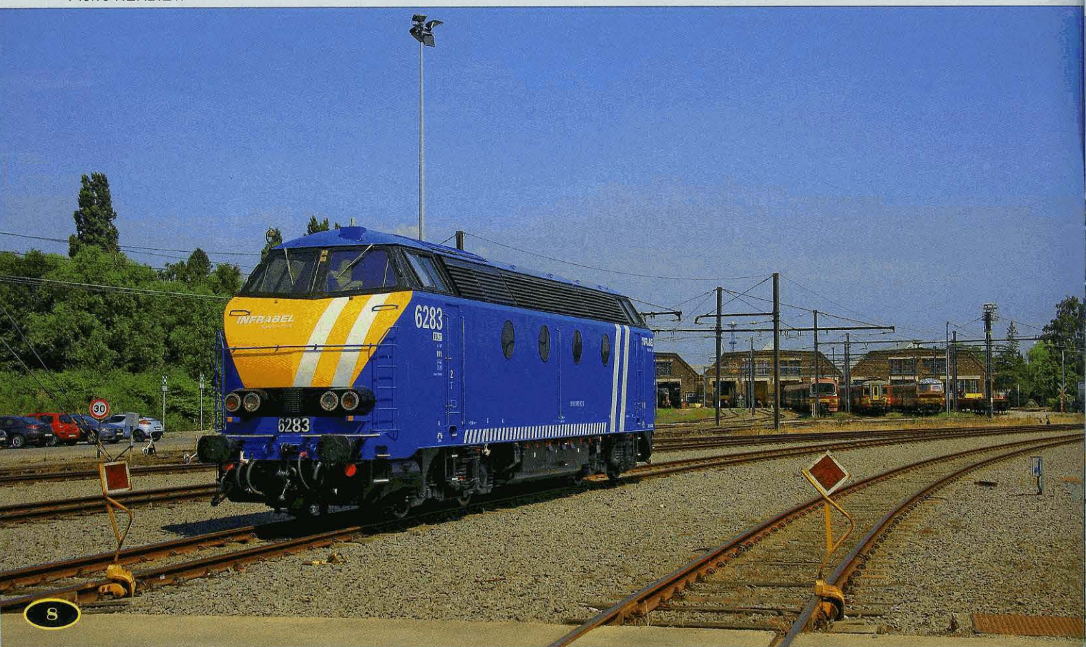
FOTO 117-07 De 6283 verliet de werkplaats in juni na een grote revisie in de nieuwe Infrabel-livrei. WET Schaarbeek, 22 juli.

BPEL: Zeebrugge Pelikaan, FGZH: Gent-Zeehaven, FIZG: Muizen-Goederen, FNND: Antwerpen-Noord, FNWHZ: Antwerpen-Waaslandhaven, LKV: Kortrijk vorming, LZR: Zeebrugge, LZVHW: Zeebrugge-Voorhaven West, RHODE: Antwerpen-Rhodesië, XFBOB: Bobigny (FR), XFCAF: Calais-Frethun (FR), XFDOU: Dourges Delta 3 (FR), XFFHS: Calais-Frethun Faisceau Tunnel (FR), XFSOM: Somain (FR), XFVS: Valenciennes (FR).