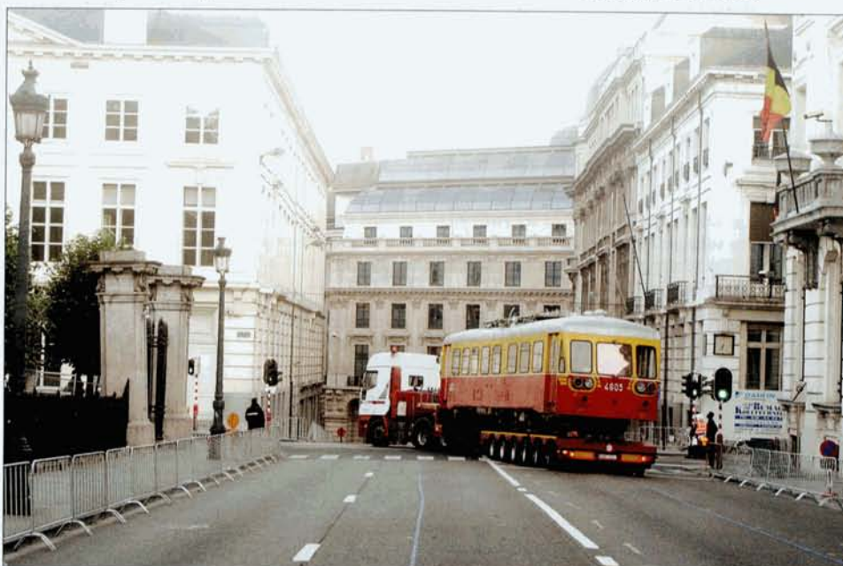
PHOTO 69-06 Le 21 juillet, au petit matin, le 4605 arpente les rue de la Capitale pour se rendre au Sablon. L'insolite convoi bifurque de la rue de la Loi vers la rue Royale. A l'extrême droite, on voit le bâtiment du Sénat.