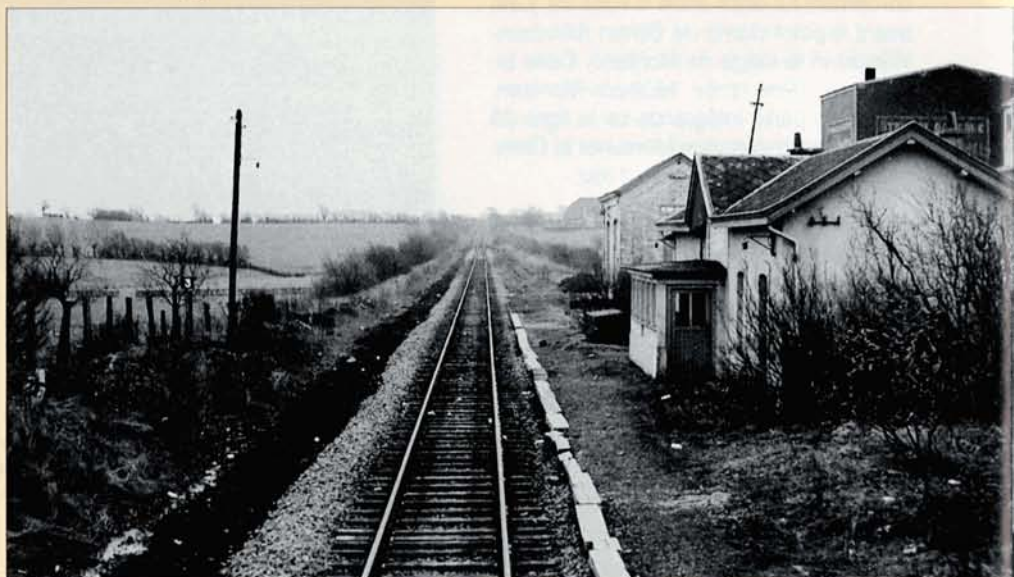
Ci-dessous - PHOTO BD-213 Le même site photographié en avril 1964. Durant la Seconde Guerre, les Allemands avaient rebaptisé la gare Heinrichs-Kapelle. Collection Georgy LEJEUNE ↑ ↓ Bruno DEDONCKER, collection PFT ©.