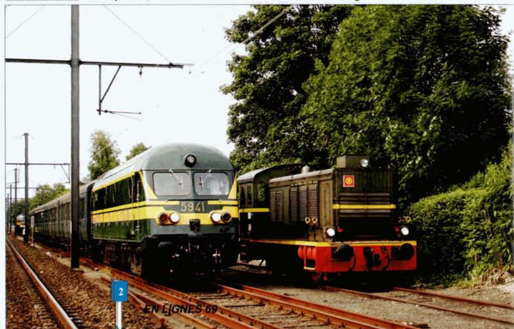
PHOTO 69-05 A Kapellen, rencontre avec le V36 de l'Armée belge.

Merci aux organisateurs de ce périple, très difficile à organiser à cause des aléas de l'exploitation du port, et aux responsables de l'Armée belge, pour avoir dégaré leur locomotive pour les amateurs du PFT.