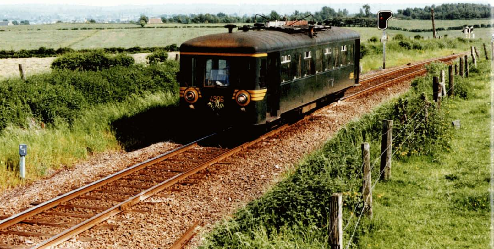
PHOTO-THEME 68 Le 3 juin 1982, le 4906 assure les navettes pour le personnel. L'autorail remonte la ligne 39 vers Montzen, à Henri-Chapelle. Avec son électrification, la ligne 39 perdra beaucoup de son pittoresque... Jean-Luc VANDERHAEGEN.

Extrait du service voyageurs sur la ligne 39 sens Gemmenich - Herbesthal, indicateur du 8 octobre 1950. Les autorails Brossel (type 553, future série 49) ont fait leur apparition.