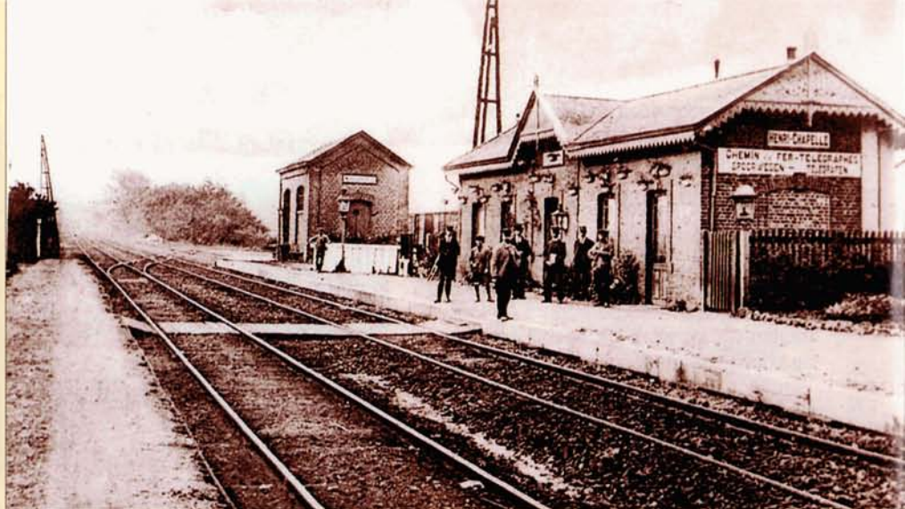
Deux documents de la gare d'Henri-Chapelle. La vue ci-dessus a été immortalisée peu avant la Première Guerre mondiale. La ligne restera à double voie jusqu'en 1957.

PHOTO BD-214 Détournement via la ligne 39 de l'International 76 Oostende - Köln. Henri-Chapelle, 27 avril 1966.