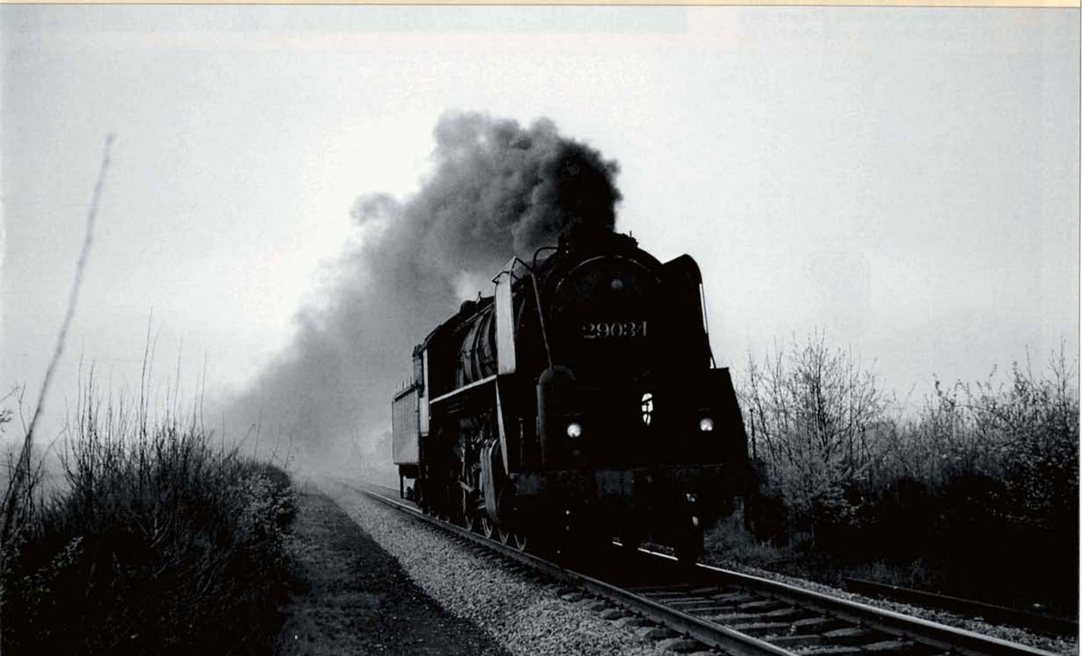
PHOTO BD-212 Le même jour, passage à vide de la 29.034 en direction de Montzen. Cette locomotive, construite par la Montreal Locomotive Works (MLW 74531), fut réceptionnée au dépôt de Schaerbeek le 5 avril 1946. Elle fut mutée à Herbesthal en février 1962, et à Aalst en mai 1966, où elle termina sa carrière. Elle sortit des écritures le 24 février 1967.