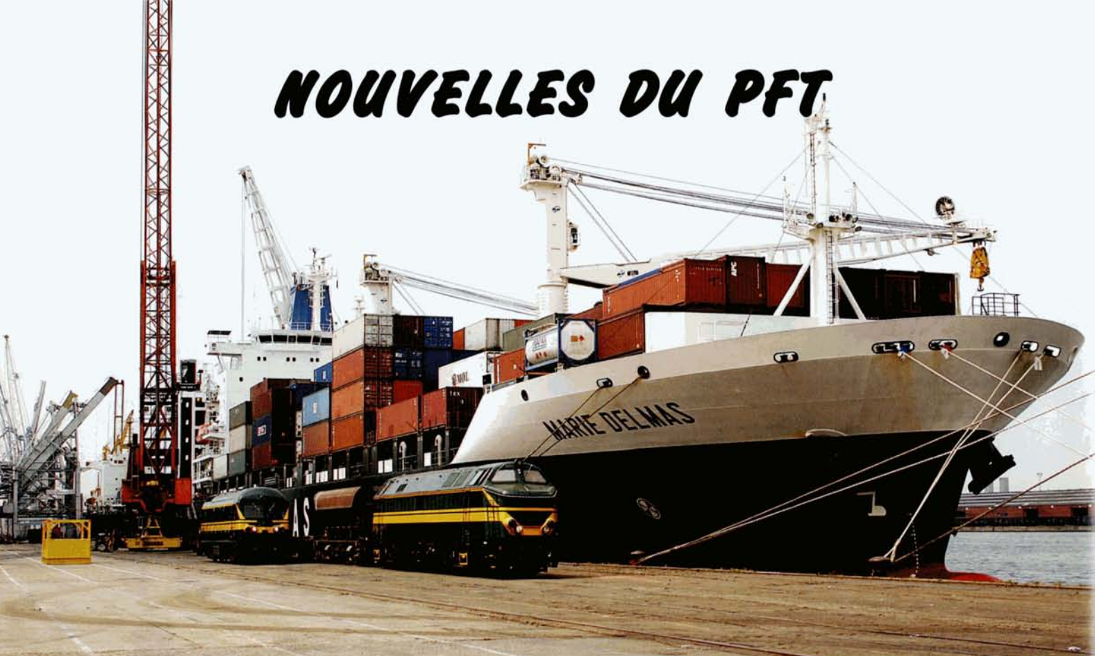
PHOTO 69-04 La 5941 et la 5166 sur le Churchilldok, le 25 juin 2005. La visite de ce quai et l'organisation d'un tel parallèle tiennent vraiment de l'exploit...