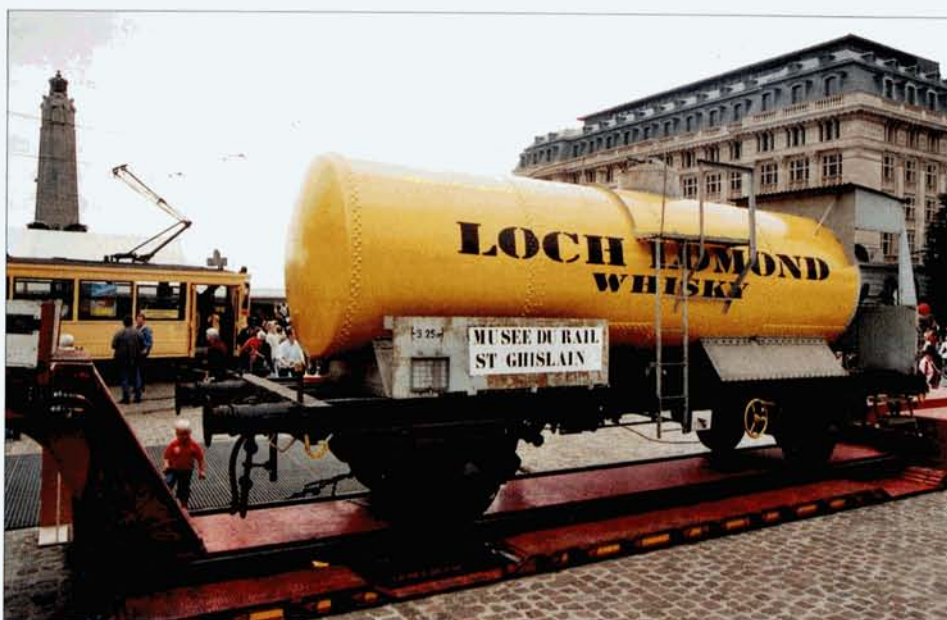
La citerne de whisky "Loch Lomond" du PFT exposée à la Place Poelart, près d'un ancien tram préservé par le Musée de Woluwé. Christian DOSOGNE.

Il reste à espérer que les nombreux visiteurs auront apprécié l'initiative du PFT et se rendront nombreux aux prochaines manifestations.