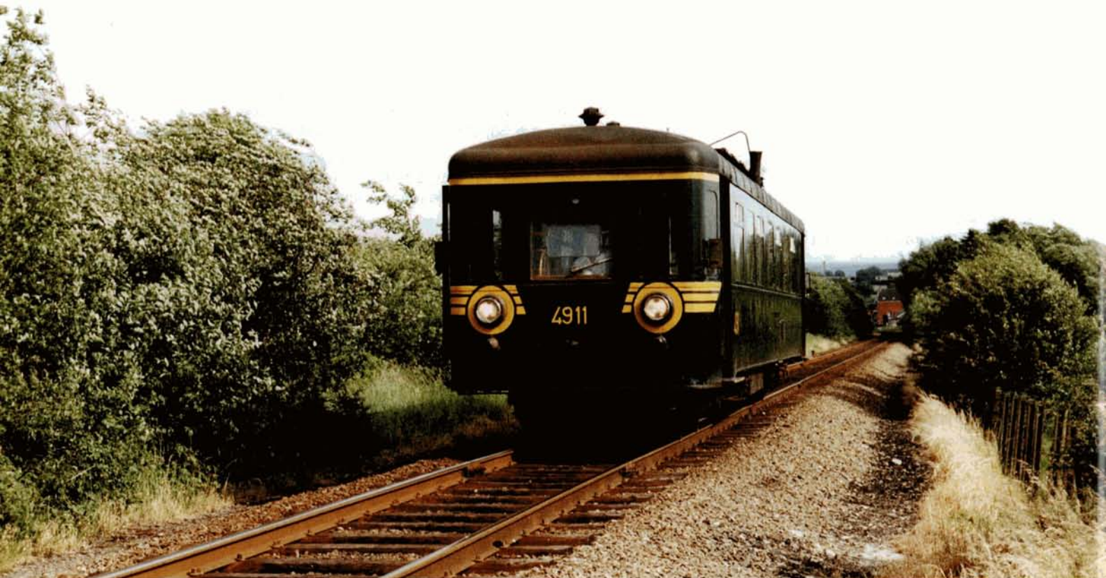
PHOTO-THEME 68 Longtemps, les navettes pour le personnel entre Welkenraedt et Montzen furent assurées par les vénérables autorails Brossel de la série 49. Le 15 juin 1981, le 4911 (ex. 553.50) vient de quitter Welkenraedt en direction de Montzen. J-L VANDERHAEGEN.

En marge de l'électrification prochaine de la ligne 39 entre Welkenraedt et Montzen, voici un reportage photographique sur cette petite liaison. Commençons d'abord par un brin d'histoire.