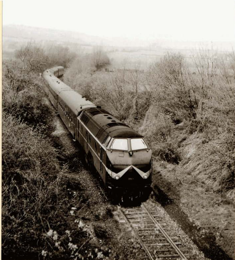
Le 27 avril 1966, passage exceptionnel de l'International 181 Paris-Nord - Hannover détourné par la ligne 39 et Aachen West, photographié entre Henri-Chapelle et Montzen. En tête, la 205.011.

Outre le trafic marchandises, la ligne drainait un important service voyageurs. Entre les deux guerres, suivant les années, on comptait une quinzaine d'allers-retours quotidiens. Tous avaient comme origine la gare de Herbesthal (parfois même Raeren), tandis que les destinations finales étaient fort variées : Aachen West, Liège, Visé, Beyne, La Calamine, Tongeren, Verviers et même Tienen !