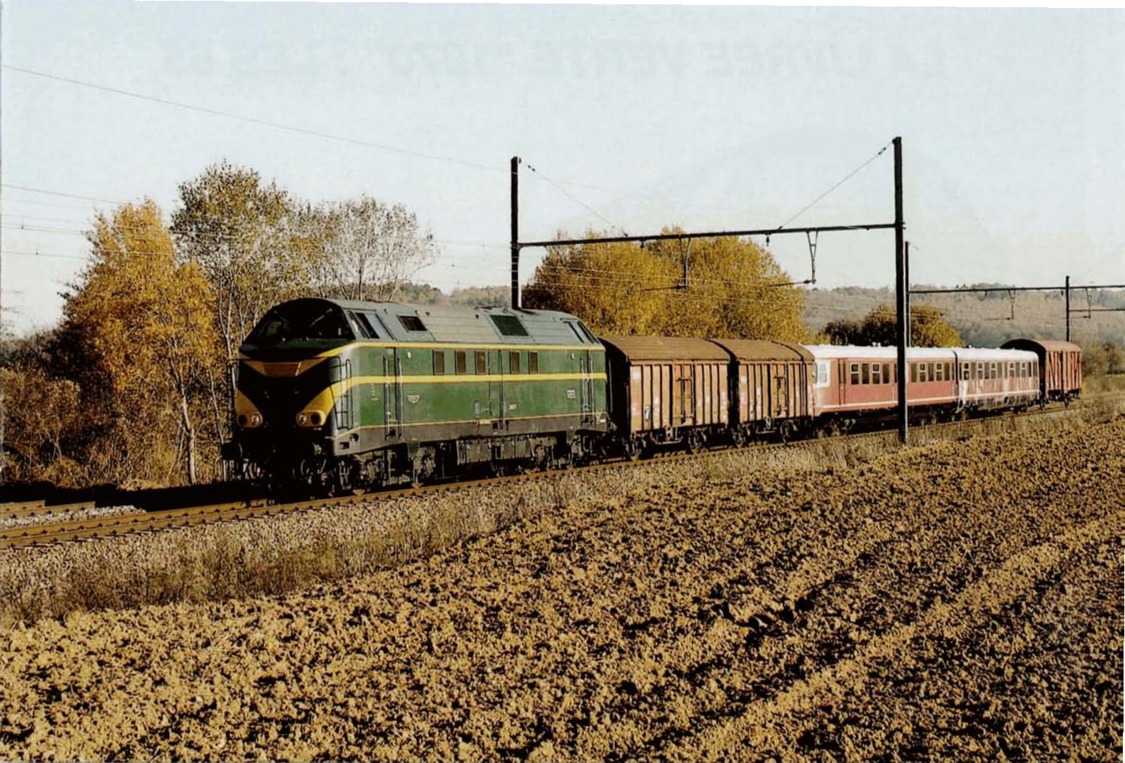
Le transfert du Westwaggon de Montzen à Gouvy fut assuré par la 6077 le 9 novembre. Ci-dessus à Warsage (ligne 24 Montzen - Visé); ci-dessous à Coö. Cet autorail a été acquis par l'association luxembourgeoise AMTF.