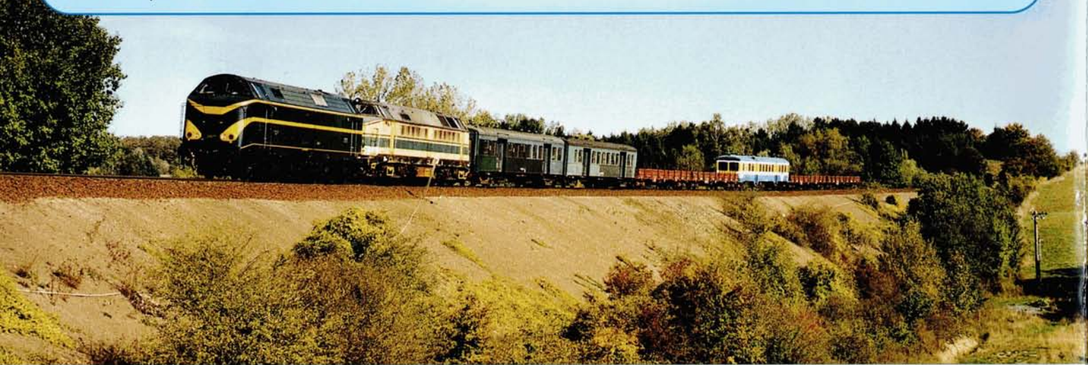
PHOTO 59-03 Le 26 septembre, la 6077 du PFT assura le transfert de la 5120, du 4407 et de deux voitures du type M1 vers Mariembourg.

Merci encore pour votre soutien et... bonne lecture !