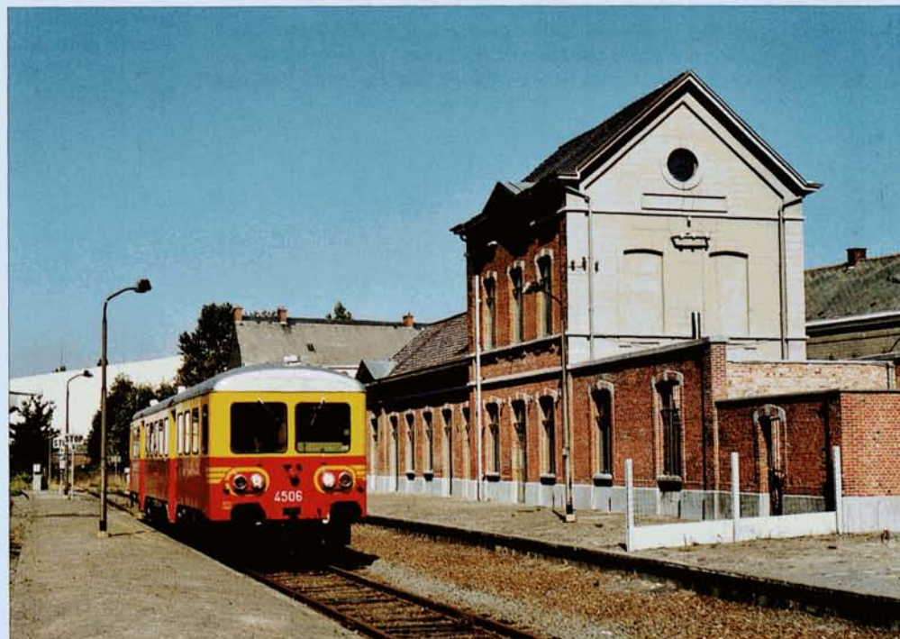
PHOTO 59-05 - Le 4506 devant la gare de Frasnes-lez-Anvaing, le 20 septembre 2003. Baudouin DIEU.