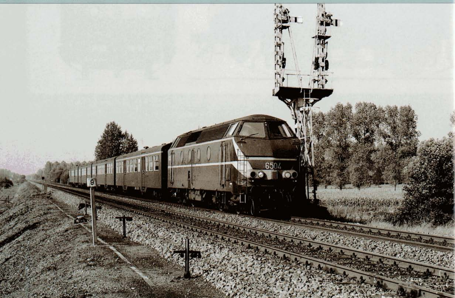
PHOTO 59-12 NB Le 7 octobre 1978, un omnibus Leuven - Hasselt tracté par la 6504 franchit le célèbre chandelier de Schulen. Cette locomotive reçut la livrée transitoire en 1974. Elle avait toujours cette décoration lors de sa modification en 7504, le 16 avril 1982. Eric VAN HOECK.