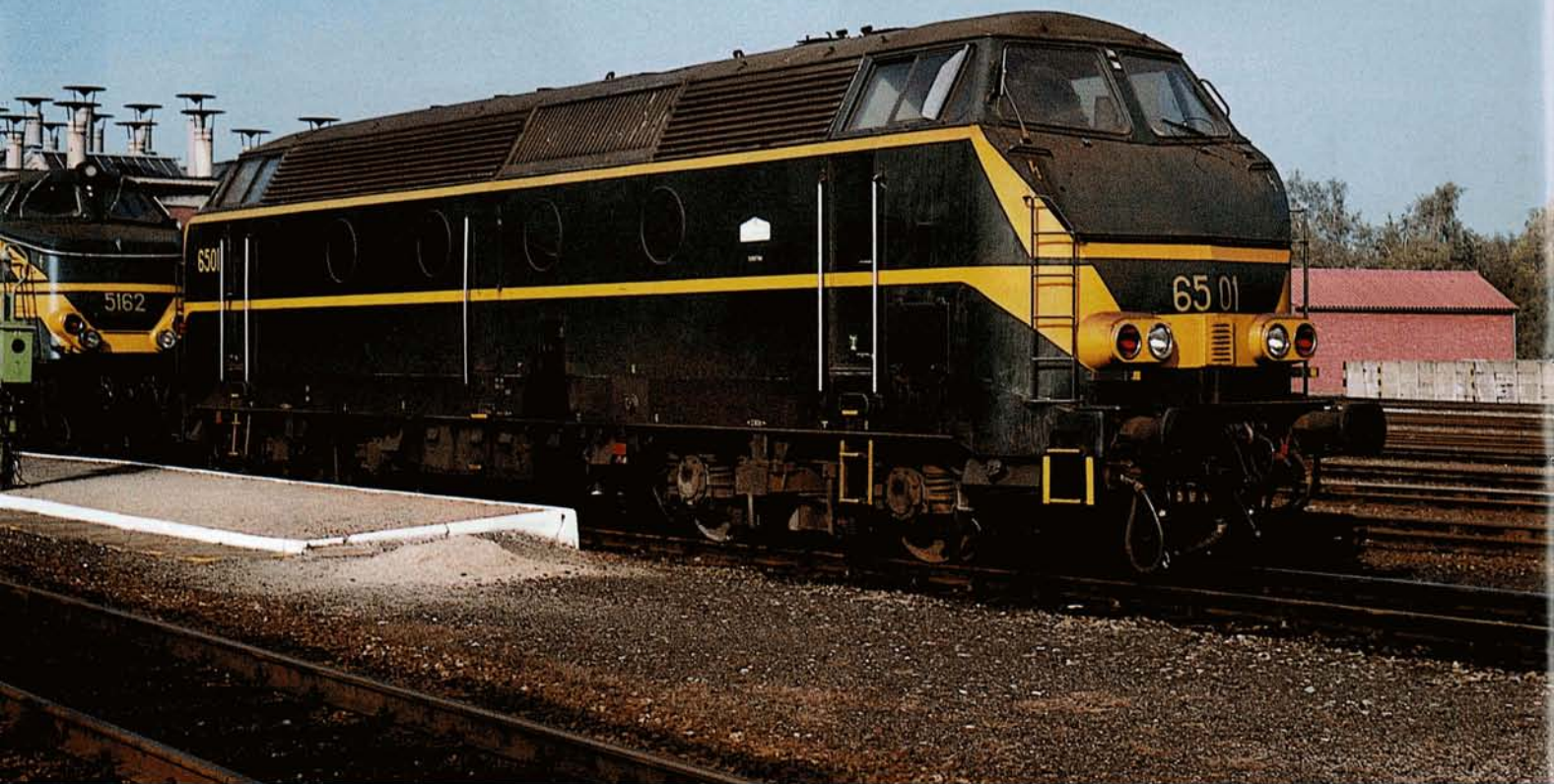
PHOTO 59-07 La 6501 subit un grand entretien de sa caisse au début de 1975. Elle ressortit le 6 mars 1975 repeinte dans la livrée transitoire. Elle sera repeinte en jaune lors de sa révision générale (sortie le 5 octobre 1979). Atelier de Hasselt, 15 octobre 1977. Yves STEENEBRUGGEN.