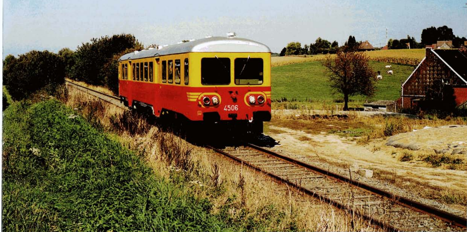
PHOTO 59-04 - Les 20 et 21 septembre, le 4506 a effectué des navettes entre Leuze et Frasnes-lez-Anvaing. Grandmetz, 20 septembre 2003.