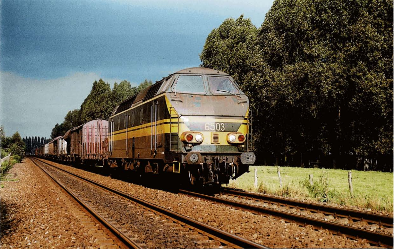
PHOTO 59-09 La 6503 en tête d'un train de marchandises Hasselt - Montzen, photographié à la sortie de la gare de Bilzen, le 23 septembre 1981. Elle reçut la livrée "1970" standard lors de sa première révision générale (sortie le 10 octobre 1974).