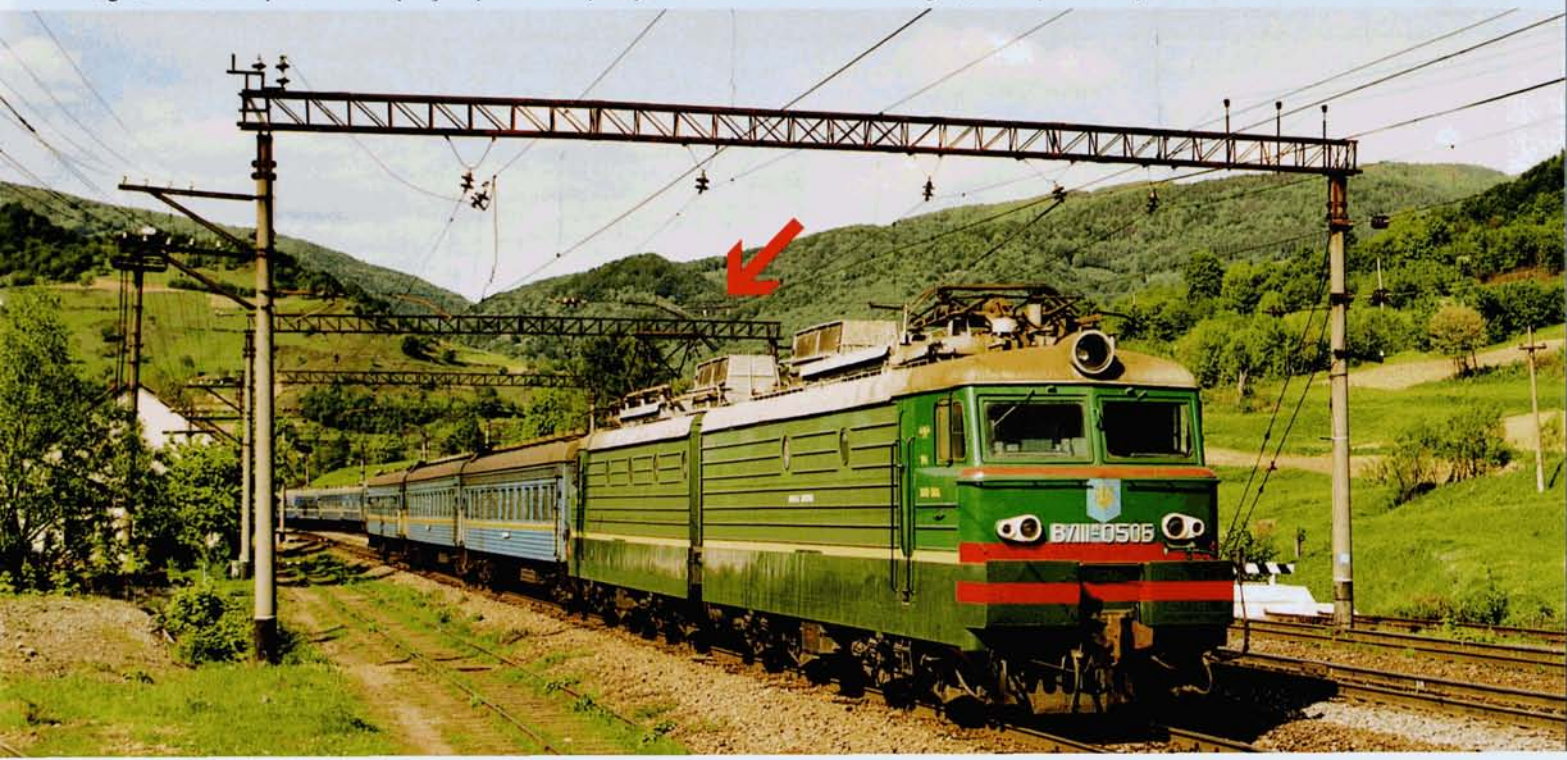
PHOTO 57-49 La ligne Chop - Lvov est en grande partie à voie unique, obligeant à de nombreux croisements comme ici à Volosyanka, avec un train local. Au départ de cette gare, notre train abordera une longue et très sévère rampe qui permettra de franchir le massif montagneux de Zakarpats'ka. On aperçoit (voir flèche) un pont au sommet de la montagne, sur lequel nous passerons.