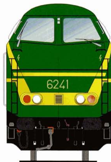
De gauche à droite : variante 3-4 (6265), variante 3-5 (6310), variante 3-3 (6241)