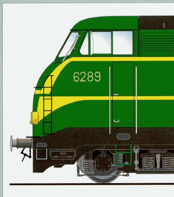
Variante 3-6 (6289)