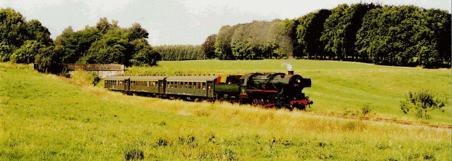
PHOTO 57-07 ↑ La 26.101, mise à l'honneur sur la ligne 128 les 20 et 21 juillet, défile entre Senenne et Braibant pour la fête nationale belge. Alain DEFECHEREUX, 21 juillet 2003.