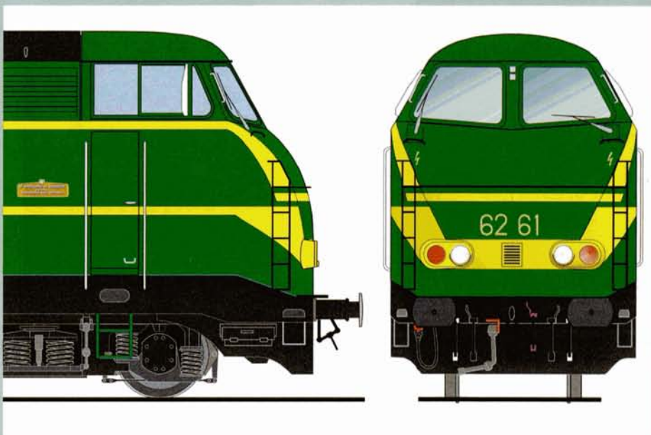
Variante 3-1 (6261)