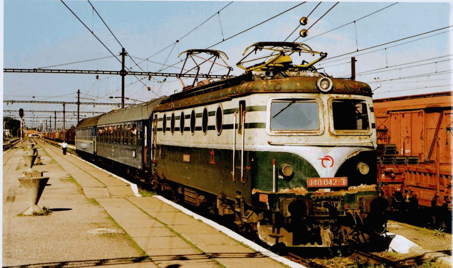
PHOTO 57-47 Après la longue halte à la frontière slovaque à Cierna nad Tisou, la 140.042-3 des Chemins de fer slovaques (ZSR) nous conduira jusqu'à Chop en Ukraine. Ce type de locomotives fut construit à 100 unités de 1953 à 1958 par Skoda (2032 kW - 3000 V).