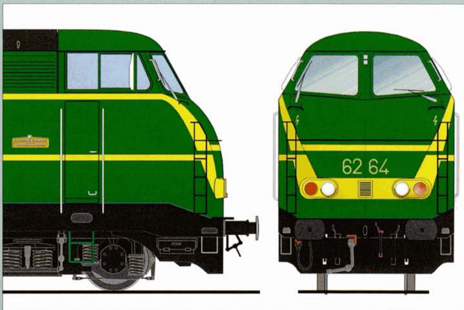
Variante 2 (6246 et 6264)

3-4 :6265 : la ligne de ceinture centrale n'était pas reliée aux blocs de phares, mais continuait horizontalement vers le milieu des nez. Etant donné que l'espace compris entre cette ligne et la bande jaune reliant les phares était insuffisant pour permettre d'y inscrire le numéro de la locomotive, il fallut l'interrompre. Ceci fut fait en biais. Le numéro n'était toutefois pas peint au milieu de la ceinture, mais plus bas. La ligne supérieure descendait aux extrémités de la caisse en suivant l'arête et s'interrompait à 2 cm de la ligne de ceinture.