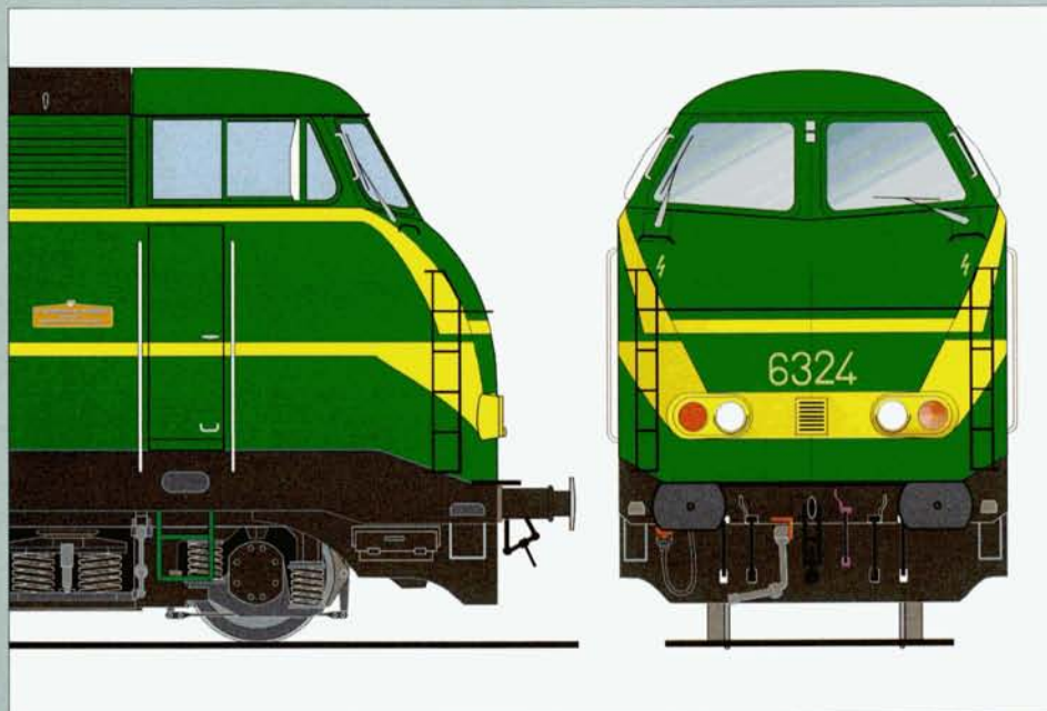
Variante 1 (6240, 6245, 6267, 6274, 6279, 6283 et 6289)

également entièrement la caisse. Aux extrémités des parois latérales, elle bifurquait vers le bas tout en s'élargissant, en suivant l'angle de l'arête des faces avant.