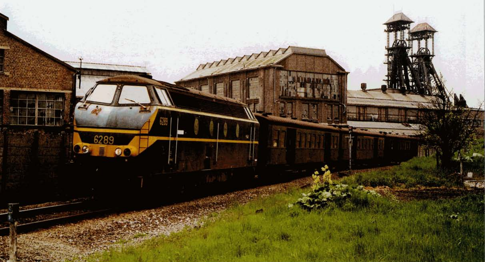
PHOTO-THEME 54 La 6289 (variante 1) en tête de l'omnibus 7336 La Louvière - Charleroi-Sud, à Forchies-la-Marche, quelques jours avant la suppression du service voyageurs sur la ligne 112 A. Cette locomotive circule actuellement toujours dans cette décoration, mais dans la nouvelle variante 3-6. Pierre HERBIET, mai 1984.