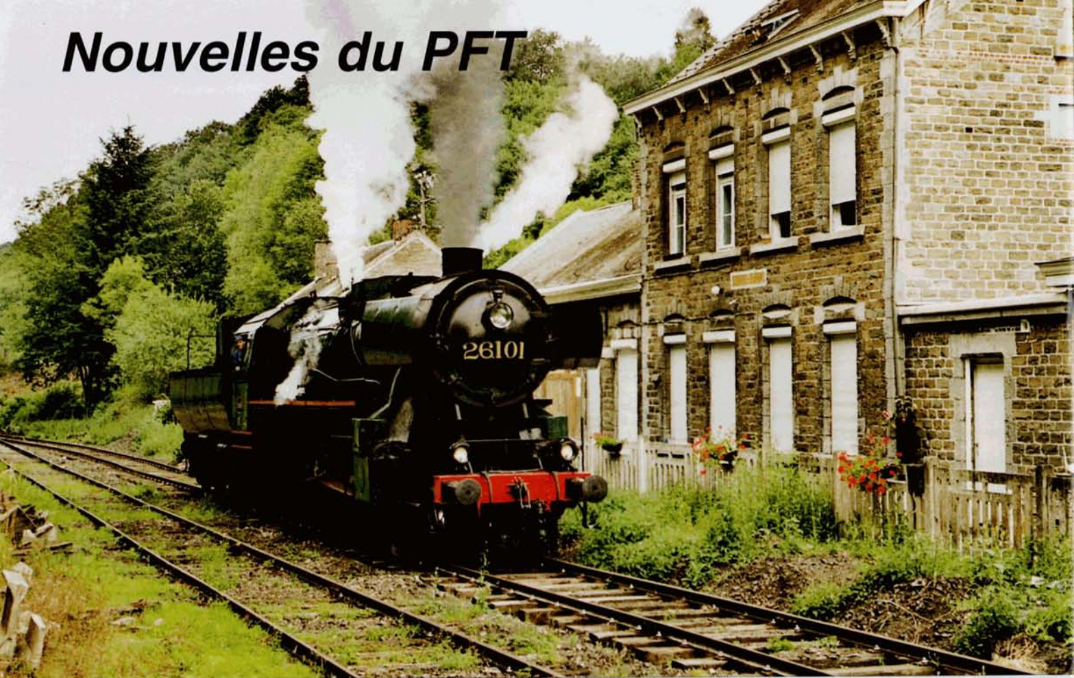
PHOTO 57-02 Pour la première fois : la 26.101 à Dorinne-Durnal. A. D.