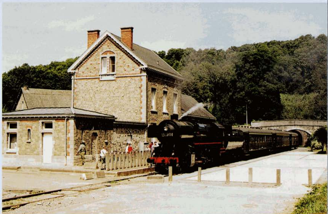
PHOTO 57-08 → La 26.101 à l'arrêt en gare de Spontin, le 20 juillet 2003. Alain DEFECHEREUX.