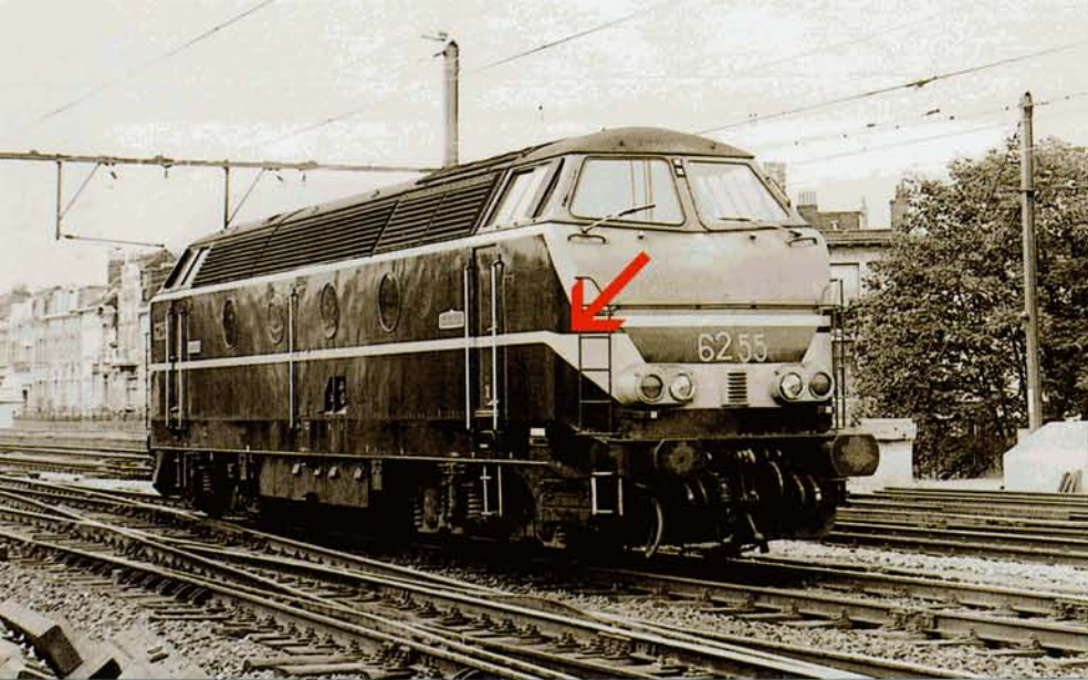
← PHOTO 57-09 NB La 6255 dans sa livrée "transitoire" particulière avec sa ligne de ceinture cassée (variante 3-2, voir flèche). Antwerpen-Schijnpoort, août 1971. Eric VAN HOECK.

3-5 : 6310 : cette machine présentait la même livrée que la 6265. Toutefois, la ligne de ceinture s'arrêtait à hauteur de l'arête des faces avant.