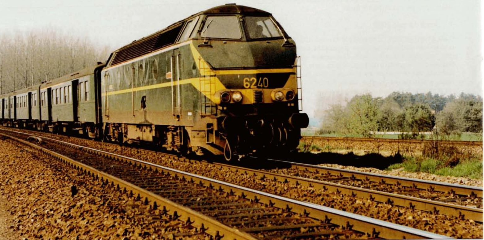
PHOTO-THEME 54 Le 16 avril 1980, un omnibus Leuven - Hasselt, remorqué par la 6240, vient de quitter Aarschot. On distingue, à droite, la ligne 16 se dirigeant vers Lier et Antwerpen. Elle conserva la livrée transitoire (variante 1) jusqu'en 1980 (ressortie en jaune le 19 août 1980). A cette époque, la 6240 était affectée à la remise d'Aarschot qui dépendait de l'atelier d'Hasselt. Jean-Luc VANDERHAEGEN.