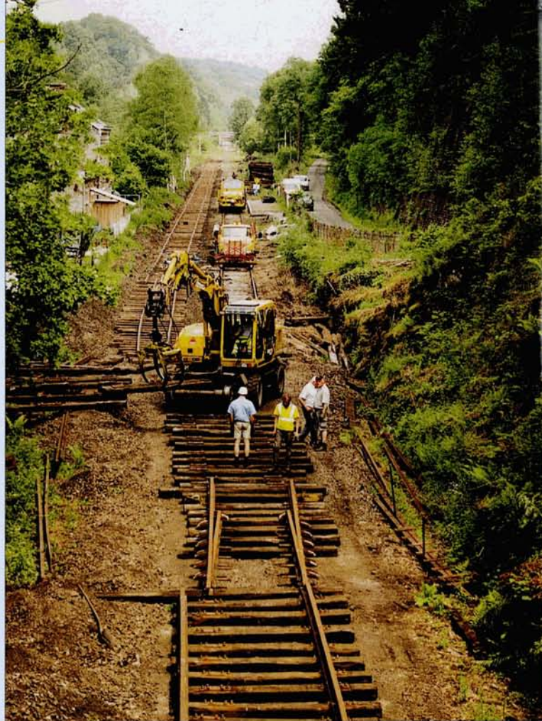
Le remplacement de l'aiguillage 202 à Dorinne-Durnal a été réalisé avec le concours de la société Sogeplan.

Aboutissement d'une année de travaux, la saison d'exploitation