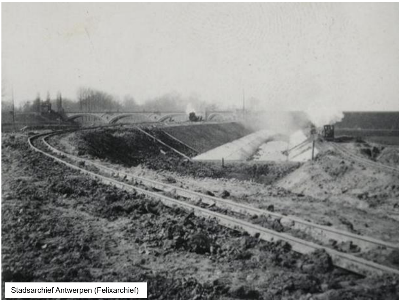
Graaf- en andere werkzaamheden aan de waterbekkens in 1934. Op de terreinen van de Antwerpse Waterwerken bevond zich een tijdelijk smalspoornet waarop verschillende werktreinen reden. De treinen werden gesleept door stoomlocomotieven. Bemerk de spoorwegbrug over de Nete en de blokpost op de linkeroever van de Nete.

Studie over het vroegere station Antwerpen-Zuid, de verdwenen en de niet-gerealiseerde spoorlijnen ten zuiden van Antwerpen – Paul Jacops & Jef Van Olmen.