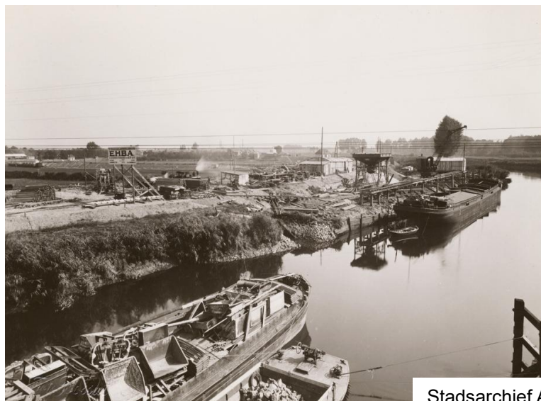
Stadsarchief Antwerpen (Felixarchief)