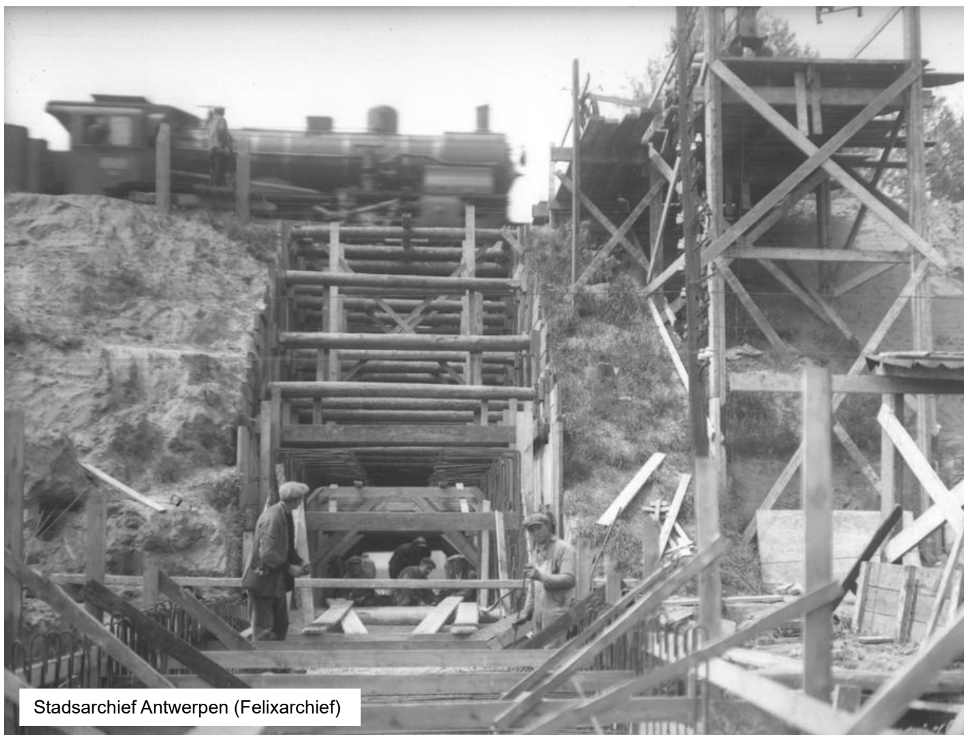
Stadsarchief Antwerpen (Felixarchief)

Een tweede foto, genomen op dezelfde locatie. Ditmaal passeert een onbekende type 66 (een ex-Pruisische S6), waarschijnlijk met een reizigerstrein. Omdat het geen brug over een openbare weg betreft, is de onderdoorgang niet opgenomen in de nummerlijst die we in dit hoofdstuk gebruiken om de bruggen te identificeren.