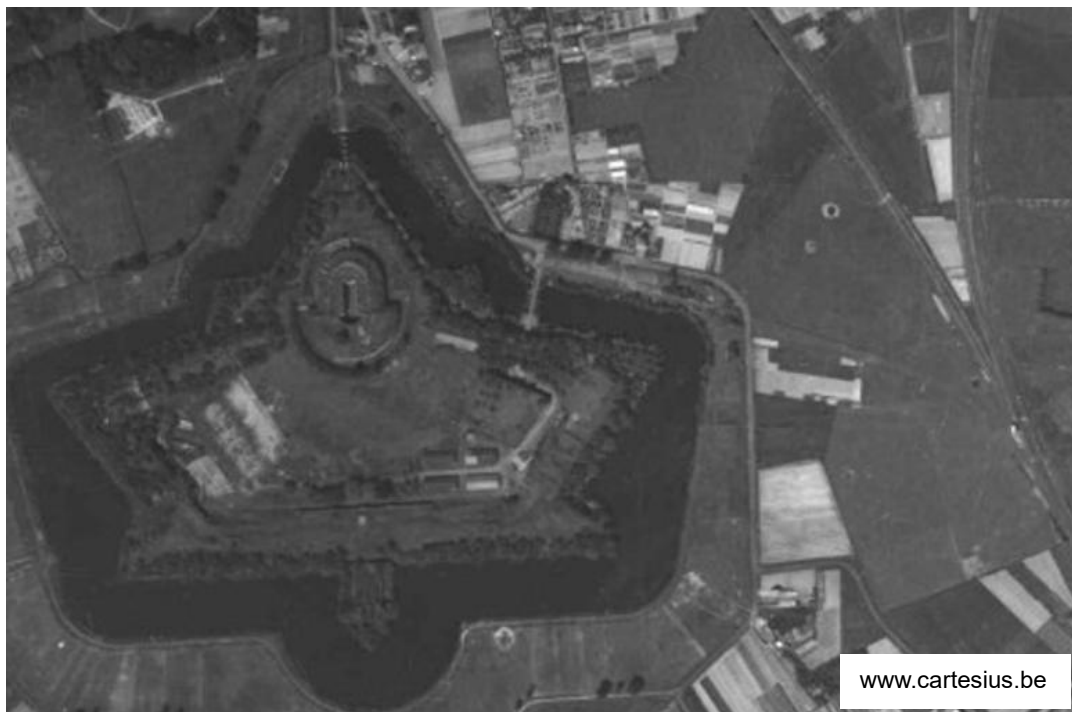
Hierboven: situatie eind jaren veertig, na de opbraak van het lijngedeelte tussen Antwerpen-Zuid en het spoorwegknooppunt van Wilrijk. Bemerkt het aansluitingsspoor van Fort 6 en de oude bedding van de opgebroken rechtstreekse lijn naar/van Antwerpen-Zuid.