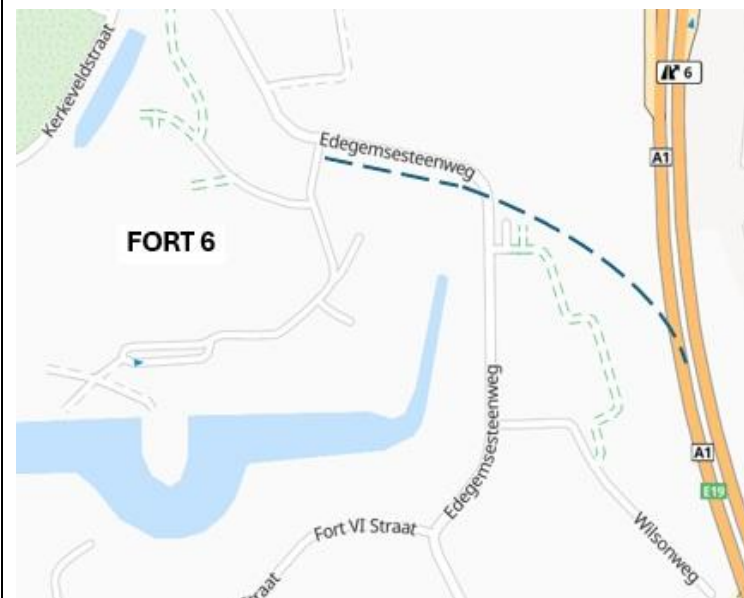
Hierboven: de huidige situatie (2025). — — — = ligging van het vroegere aansluitingsspoor van Fort 6.